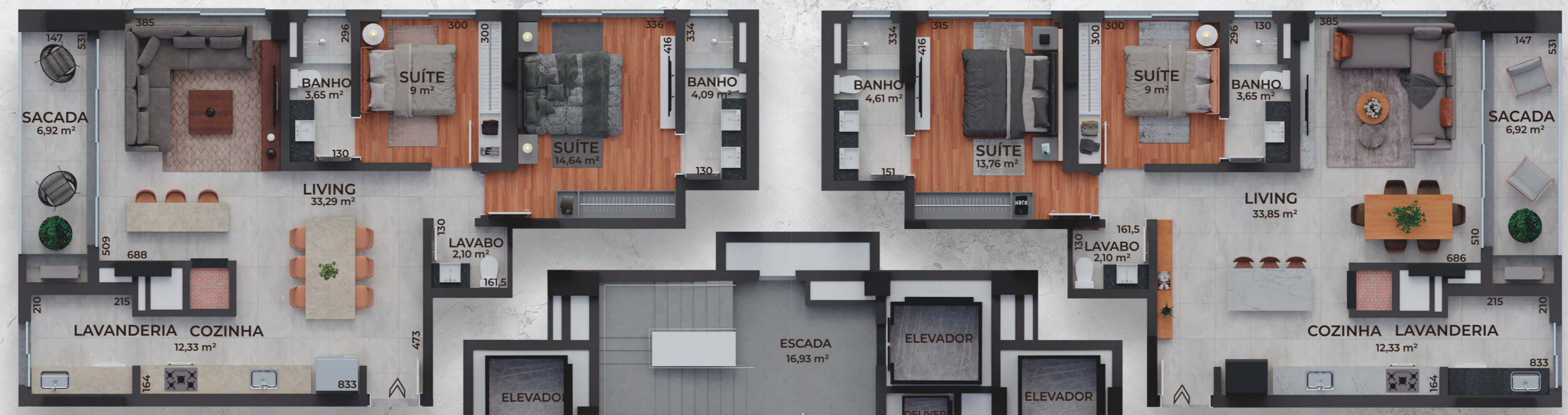
Final 4 107 m 2 PRIVATIVOS Apartamentos 1904 a 3204