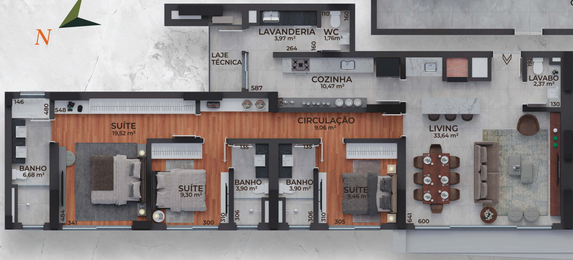
Final 1 143 m 2 PRIVATIVOS Apartamentos 1901 a 3201