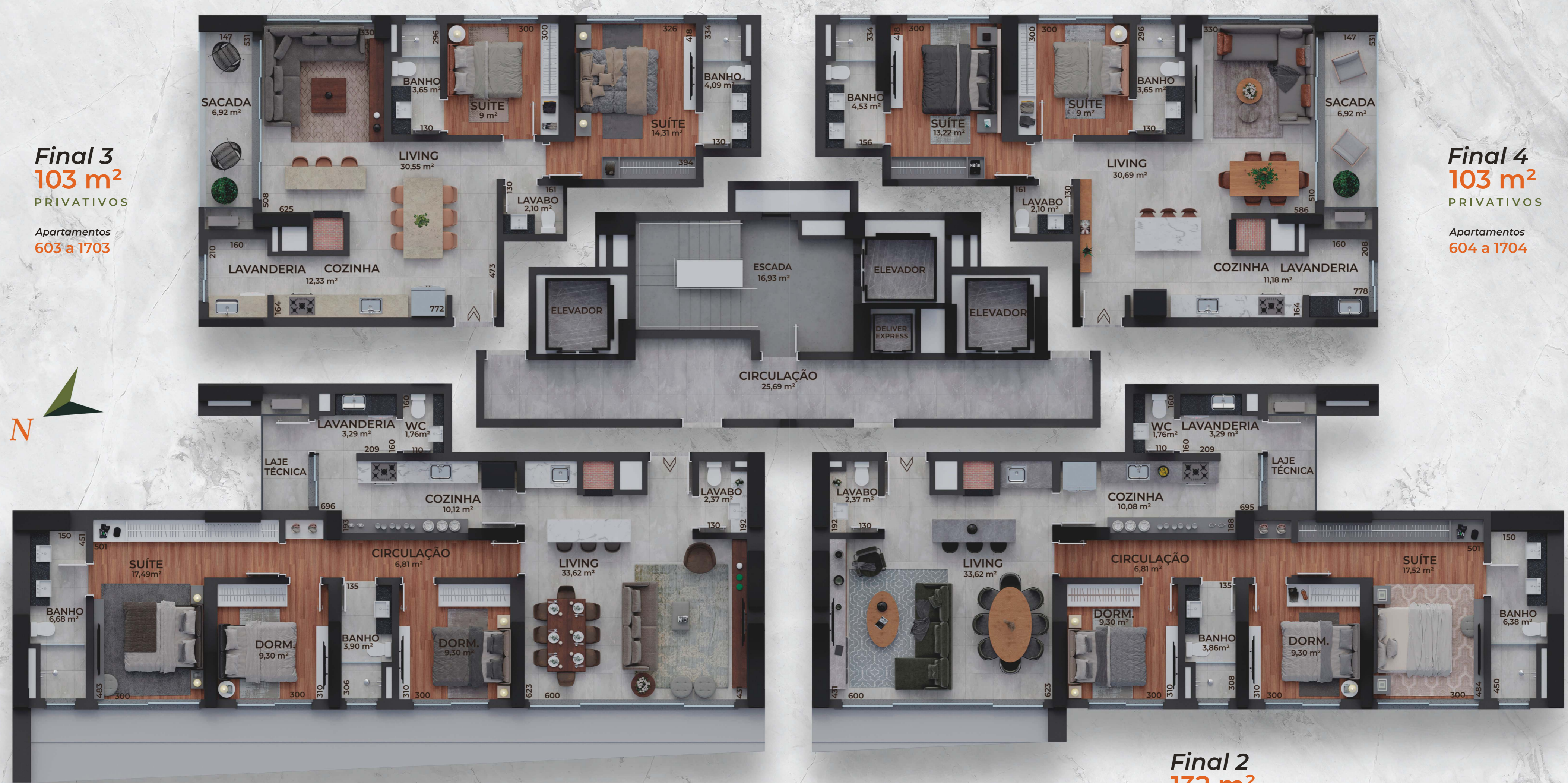
Final 3 103 m² PRIVATIVOS Apartamentos 603 a 1703